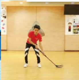
雙手（正手）持桿姿勢

國際比賽在長40米、寬20米的圓角矩形場地進行，其四周圍有圍板，圍板高50厘米。