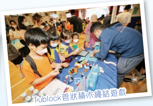
Tublock管狀積木繩結遊戲