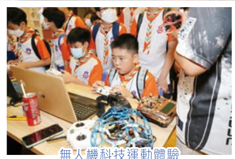
無人機科技運動體驗