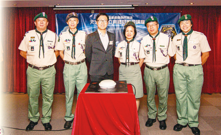
天文組成立典禮在一個簡單而隆重的亮燈儀式下正式揭幕。